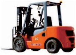
K Series Diesel CPD20/25/30/35

Rated Load:2000/2500/3000/3500kg Engine:Xinchai/Isuzu/Mitsubishi Lifting height:3000-6000mm