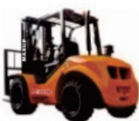
2WD Rough Terrain CPCD25/30/35

Rated Load:32000/35000kg Engine:Yuchai/Cummins Lifting height:3500-6000mm