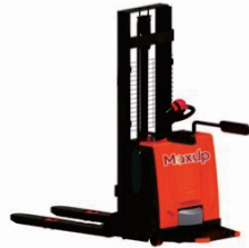
Electric Stacker TANK15 Rated Load:1500kg Battery:Lead-acid 48V/70Ah Lifting height:1600-3500mm