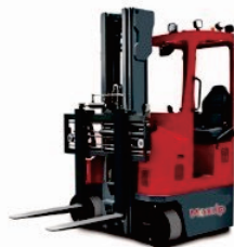
All-directional Forklift MQK30 Rated Load:3000kg Battery:Lead-acid 48V/480Ah Lifting height:3600-8000mm