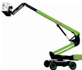
Electric Telescopic Boom Lift J24/26Li Rated Load:300kg Battery:80V/460Ah Platform height:24500/26300mm