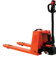
Electric Pallet Truck NPT20 Rated Load:2000kg Battery:Lead-acid 48V/25Ah