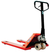
Hand Pallet Truck CBYC2/1 Rated Load: 2000/2500/3000kg