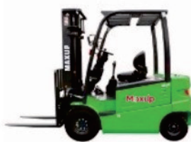
N Series Lithium LG20/25B Rated Load:2000/2500kg Battery:80V/205Ah Lifting height:3000-6000mm