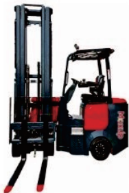
Articulated Forklift NA15-30 Rated Load:1500/2000/2500/3000kg Battery:Lead-acid 80V/500Ah Lifting height:4300-15000mm