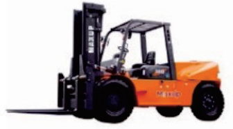
LG Series Diesel LG85/100DT

Rated Load:8000/10000kg Lifting height:2100-2500mm