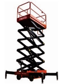
Manual Walkie Platform SJY Series Rated Load:500kg Battery:48V/70Ah Platform height:7000/9000/11000mm