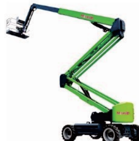
Electric Articulating Boom Lift V18/20 Rated Load:230kg Battery:48V/400Ah Platform height:18200/20500mm