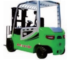
C Series Lead-acid CPD40/50C Rated Load:4000/5000kg Battery:80V/300/350Ah Lifting height:3000-6000mm