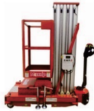
Single Mast Aluminum Alloy Platform GTWY-A Series Rated Load:125kg Battery:24V/70Ah Platform height:6000/8000/9000mm