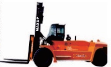
LG Series Diesel HNF-320/350

Rated Load:28000/30000kg Engine:Yuchai/Cummins Lifting height:3500-6000mm