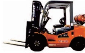
T2 Series LPG CPQYD20/25/30/35

Rated Load:2000/2500/3000/3500kg Engine:Xinchai/Isuzu/Mitsubishi Lifting height:3000-6000mm