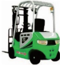
C Series Lead-acid CPD20/25C Rated Load:2000/2500kg Battery:72V/210Ah Lifting height:3000-6000mm