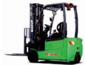
N Series 3 wheels Lithium LG16/18/20BE Rated Load:1600/1800/2000kg Battery:80V/150Ah Lifting height:3000-6000mm