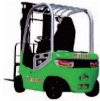
C Series Lead-acid CPD10/15C Rated Load:1000/1500kg Battery:60V/120Ah Lifting height:3000-6000mm