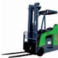
N Series Counterbalance Lead-acid MN18 Rated Load:1800kg Battery:48V/460Ah Lifting height:3000-6000mm