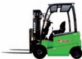
N Series Lithium LG15/18B Rated Load:1500/1800kg Battery:80V/205Ah Lifting height:3000-6000mm