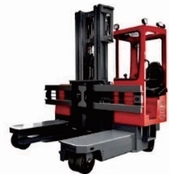
All-directional Reach Truck (Seated)MQC25/30/35/50 Rated Load:2500/3000/3500/5000kg Battery:Lead-acid 48V/500/560Ah Lifting height:4500-8000mm