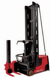
Man-up 3-way Stacker MCC16 Rated Load:1600kg Battery:Lead-acid 80V/560Ah Lifting height:4500-9500mm