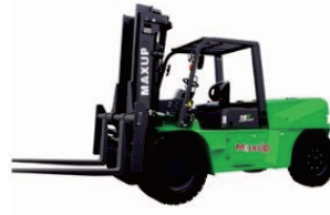
E Series Lithium CPD50/60/70 Rated Load:5000/6000/7000kg Battery:96V/600Ah Lifting height:3000-6000mm