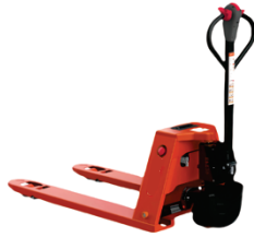
Electric Pallet Truck EPT15/20 Rated Load:1500/2000kg Battery:Li-ion 48V/15Ah