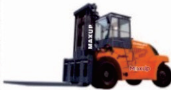
LG Series Diesel LG160DT

Rated Load:12000/13500kg Engine:Xichai/Cummins Lifting height:3000-6000mm