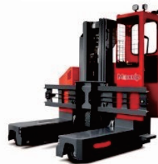
All-directional Reach Truck (stand-on)MQ25/30 Rated Load:2500/3000kg Battery:Lead-acid 48V/400/460Ah Lifting height:4500-8000mm