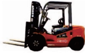
T2 Series Diesel CPD20/25/30/35

Rated Load:2000/2500/3000/3500kg Engine:Xinchai/Isuzu/Mitsubishi Lifting height:3000-6000mm