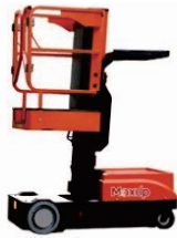
Stand-on Order Picker OPC03/04M Rated Load:110kg Battery:24V/108Ah Platform height:3000/4000mm