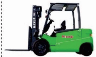
N Series Lithium LG40/50B Rated Load:4000/5000kg Battery:80V/410Ah Lifting height:3000-6000mm