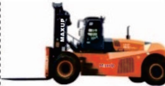
LG Series Diesel HNF-280/300

Rated Load:16000kg Engine:Weichai/Cummins Lifting height:3500-6000mm