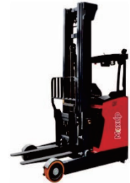
Seated Reach Truck MFZ16/20 Rated Load:1600/2000kg Battery:Lead-acid 48V/420Ah Lifting height:4500-10000mm