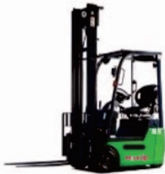
N Series Elevator Use Lithium CPDS08/10 Rated Load:800-1000kg Battery:24V/250Ah Lifting height:3000-6000mm