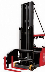
Seated 3-way Stacker MCA16 Rated Load:1600kg Battery:Lead-acid 48V/600Ah Lifting height:4500-12000mm