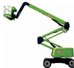
Diesel Articulating Boom Lift V18/20D Rated Load:230kg Engine:Kubota Platform height:18200/20500mm