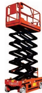
Self-Propelled Platform SJC0810/1012/1214/1416 Rated Load:320/230kg Battery:24V/200/240Ah Platform height:8/10/12/14m