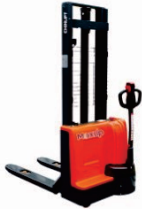
Electric Stacker PSL15/20 Rated Load:1500/2000kg Battery:Lead-acid 48V/40Ah Lifting height:1600-3500mm