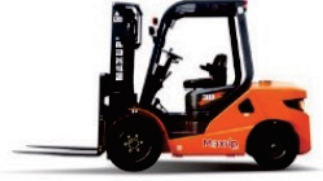
LG Series Diesel LG20/25/30/35DT

Rated Load:2000/2500/3000/3500kg Engine:GCT K21/25 Lifting height:3000-6000mm