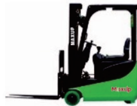
G Series 3 wheels Lead-acid E10/13/15/30GS Rated Load:1000/1300/1500kg Battery:24V/300/350/400Ah Lifting height:3000-4500mm