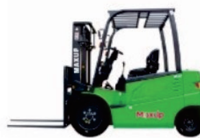
N Series Lithium LG30/35B Rated Load:3000/3500kg Battery:80V/280Ah Lifting height:3000-6000mm