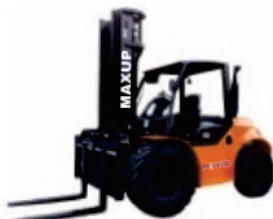
4WD Rough Terrain CPCD25/30/35/50

Rated Load:2500/3000/3500kg Engine:Xinchai/Kubota Lifting height:3000-6000mm