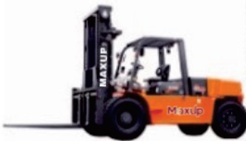
LG Series Diesel LG120/135DT

Rated Load:8500/10000kg Engine:Xichai/Isuzu Lifting height:3000-6000mm