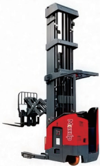
Scissor Reach Truck MFE14/20 Rated Load:1400/2000kg Battery:Lead-acid 48V/550Ah Lifting height:5000-10000mm