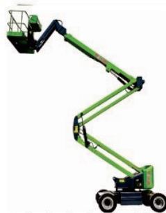
Electric Articulating Boom Lift V12/14/16 Rated Load:230kg Battery:48V/220/300Ah Platform height:11.5/13.8/15.8m