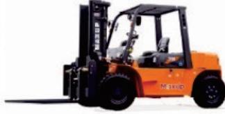
LG Series Diesel LG50/60/70DT

Rated Load:4000/5000kg Engine:Xichai/Mitsubishi Lifting height:3000-6000mm