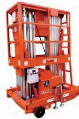
Double Mast Aluminum Alloy Platform GTWY Series Rated Load:200kg Battery:24V/70Ah Platform height:6/8/10/12m