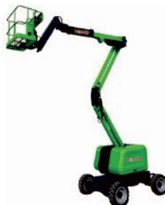
Diesel Articulating Boom Lift V14/16D Rated Load:230kg Engine:Kubota Platform height:14000/15900mm