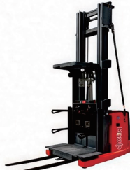
Order Picker MHB13 Rated Load:1360kg Battery:Lead-acid 48V/450Ah Lifting height:6000-9000mm