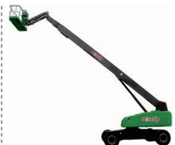
Diesel Telescopic Boom Lift V24/26/30D Rated Load:230kg Engine:Cummins Platform height:24200/26000/30000mm