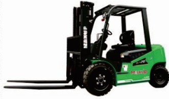
E2 Series Lithium CPD20/25/30/35 Rated Load:2000/2500/3000/3500kg Battery:80V/205/280/350Ah Lifting height:3000-6000mm