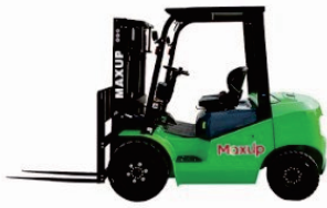
E Series Lithium CPD20/25/30/35 Rated Load:2000/2500/3000/3500kg Battery:80V/205/280/350Ah Lifting height:3000-6000mm