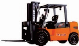
LG Series Diesel LG40/50DT

Rated Load:2000/2500/3000/3500kg Engine:Xinchai/Isuzu/Mitsubishi Lifting height:3000-6000mm