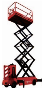
Stand-on Driving Platform SJY-Z Series Rated Load:500/300kg Battery:48V/70Ah Platform height:7/9/11/12.85m