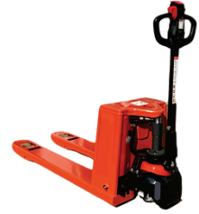
Electric Pallet Truck PT30 Rated Load:3000kg Battery:Lead-acid 48V/40Ah