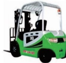
C Series Lead-acid CPD30/35C Rated Load:2000/3500kg Battery:72V/260Ah Lifting height:3000-6000mm