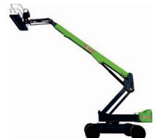
Electric Telescopic Boom Lift J16/18/20 Rated Load:300kg Battery:48V/400Ah Platform height:16000/18500/19600mm