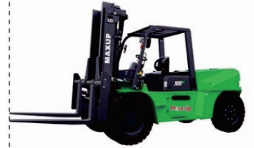
E Series Lithium CPD85/100 Rated Load:8500/10000kg Battery:96V/920Ah Lifting height:3000-6000mm