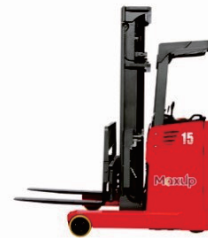
Stand-on Reach Truck MF15/20 Rated Load:1500/2000kg Battery:Lead-acid 48V/300Ah Lifting height:3000-7500mm