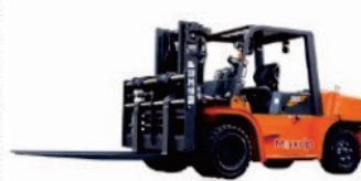
LG Series Container Operation LG80/100DT

Rated Load:5000/6000/7000kg Engine:Xichai/Isuzu/Mitsubishi Lifting height:3000-6000mm